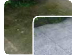
Granit- terrasse vorher

Bis 1:5 verdünnbar, je nach Verschmutzungsgrad. 1l reicht für bis zu 20 m 2 .