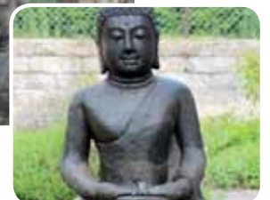
mit Finalit behandelt