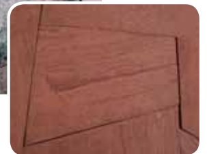
mit Finalit behandelt