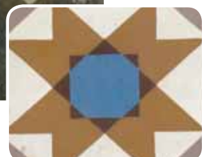
mit Finalit behandelt