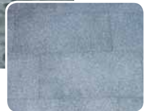
mit Finalit behandelt