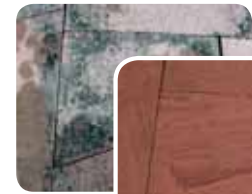
Roter Sandstein vorher

Bis 1:20 verdünnbar, je nach Verschmutzungsgrad. 1l reicht für bis zu 80 m 2 .