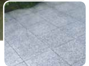
mit Finalit behandelt